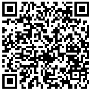
本校校區平面圖 QR Code